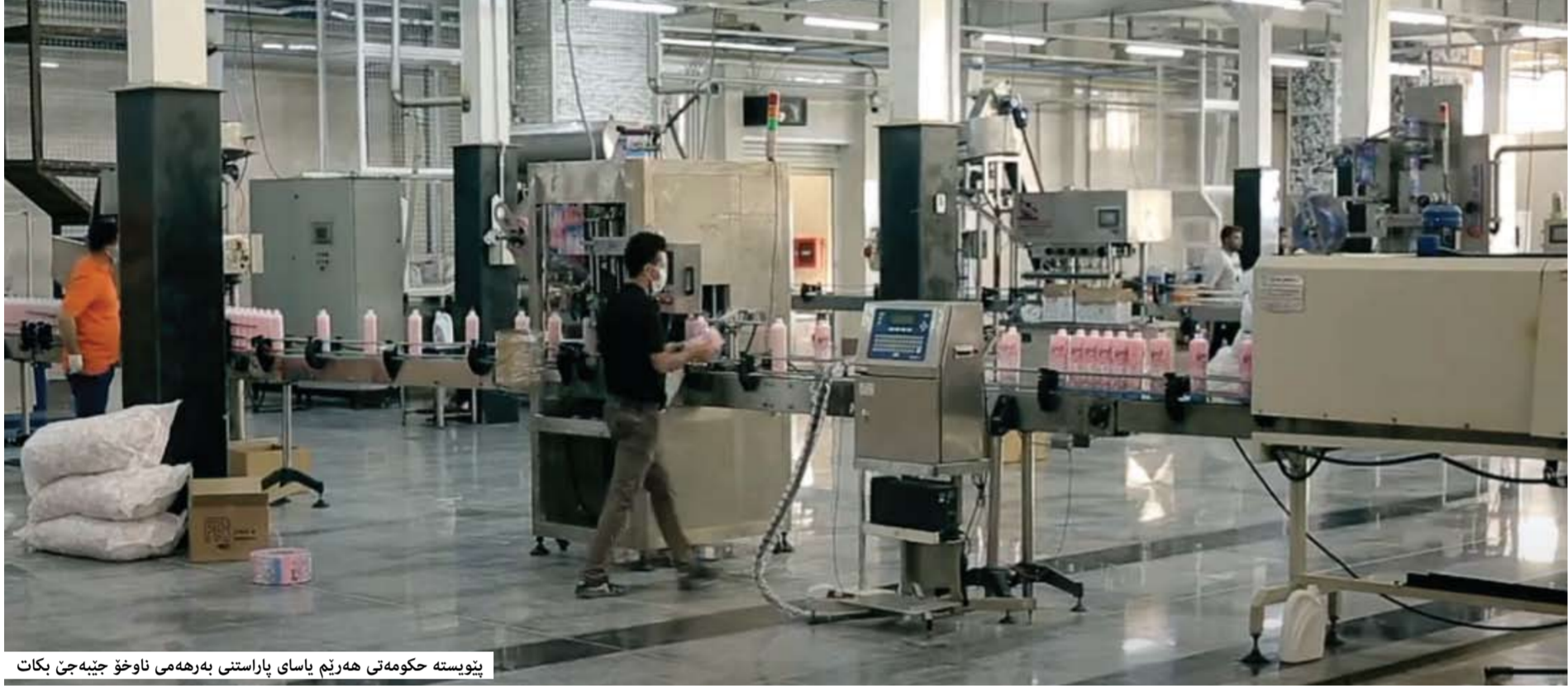
پىويستە حكومەتى ھەرىم ياساى پاراستنى بەرھەمى ناوخرۆ جىبەچى بكات