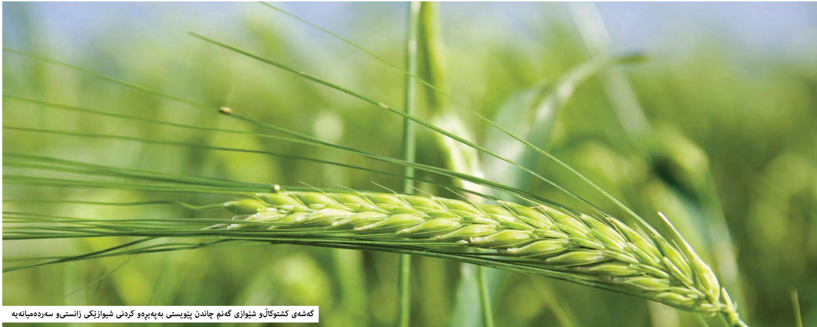
گەشە کشتوكالو شیوازی گەنم چاندرن پیوستی بەپەیرهو کردنی شیوازیکی زانستی و سەردەمیانه‌یه