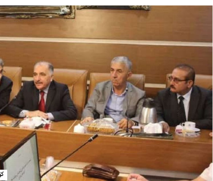
كۆبوونوهوى جیڤگري سەروۆكى ژوور لەشارى سنه

بەپۆیەى ناوچە قەرەبالەكانو شارەكان پۆیوسىتى زیاتریان بەدرەختو سەوزایى