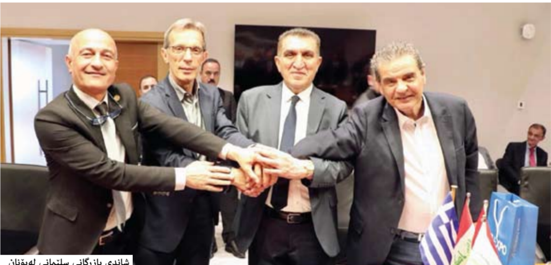
شاندي بازارگانی سلیمانای له یونان

دوای په یوه نډییه هممهانگی بهر د هوام له گهډ کونسولگری ولاتی یونان له شاری هه ولیر بۇ دروستکردنی پردی په یوه وندی له نیوان ژوری بازارگانیو پیشه ساززی سلیمانوی ژوره بازارگانییه کانی ولاتی یونان، زه مینه سیزان کرا بۇ سر دانی شان دیک بازارگانی له هه ریمتی کورستانه وه بۇ شاری سالونیککی یونان. شانده که له ۴۰ بازارگانو خاوندکار پیکه اتیوسو له یواره جیاوازه کانی بازارگانی گشتی، کشتوکالی، وه بهرینان، پیشه ساززی، خاوند کیکلگی په له وری، بازارگانانای عه لوی سلیمانوی سه ریکی کومه له کیلگه په له وریه کازو بهرینه بهری پيشانگای نیوده وله تسی سلیمانوی. بۇ په که مچار بسو له کاری بازارگانی هابه شدا شان دیک ب م ژماره په سر دانی نو ولته بکات.