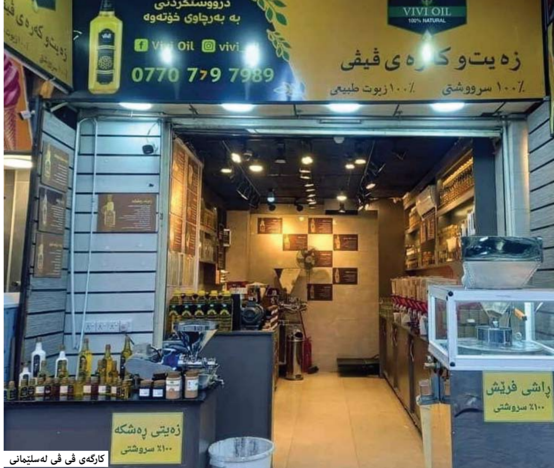
كارگەى قى قى لەسلېمانى

بازرگانىو پيشەسازى: ھاولاتيان تا فرۆشەى ھەمانە ھاولاتيان كۆپرى بەرھەمكەتتانىز . بەرھەمكەتتان دەكرەو بەكارىدەھيئەتو دىيارە لەسەرى ھاولاتياندا بىزىو باشتريەن جۆرى كوالىتى زەيتيان پىشكەش بگەينو خۇشەتان دەتوانن بەھاولاتيان بلىنن كوالىتى بەرھەمكەتتان چۆن.