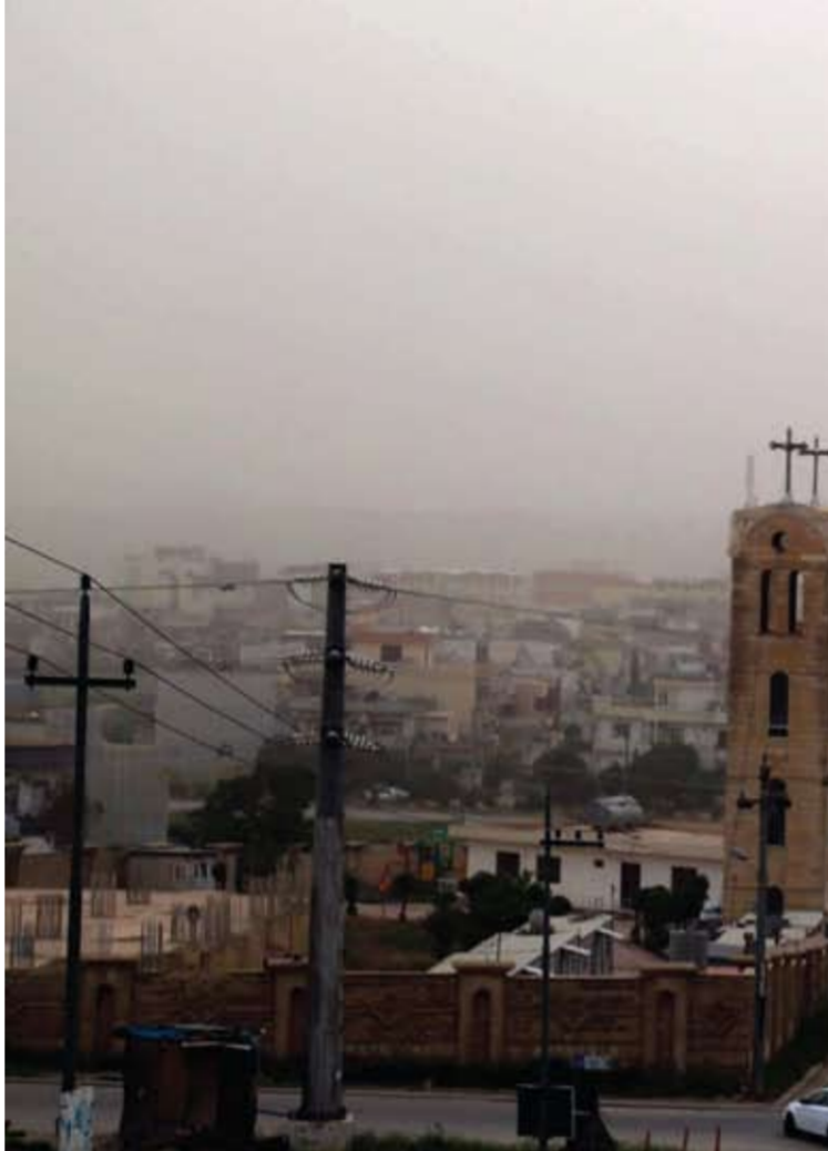
چارەسەرى خۇلبارين پىئويىتى بەكارى ھەرەۋەزى ھەموو ۋلاتانى ناۋچەكەيە

بەرئوبەرى كەشناسى ئەۋە روئدەكاتەۋە كە سەرچاۋەى خۇلبارىنەكان تەنھا لەناوخۇى عىراقو بىبابانەكانى رۆژئاۋاى عىراقەۋە سەررەلئادەن، بەرەۋ بەبىبابان بوون دەچن بەتابيەتى ناۋچەكانى گەرميان، ئەمە جگە لەۋەى خۇلبارىنانەى كە ئىسىتا روبايرىكى فروانى ناۋچەكەى گرتۋەتەۋە لەۋلاتانى باكوررى ئەفرىقاۋە سەررەلدەدات،