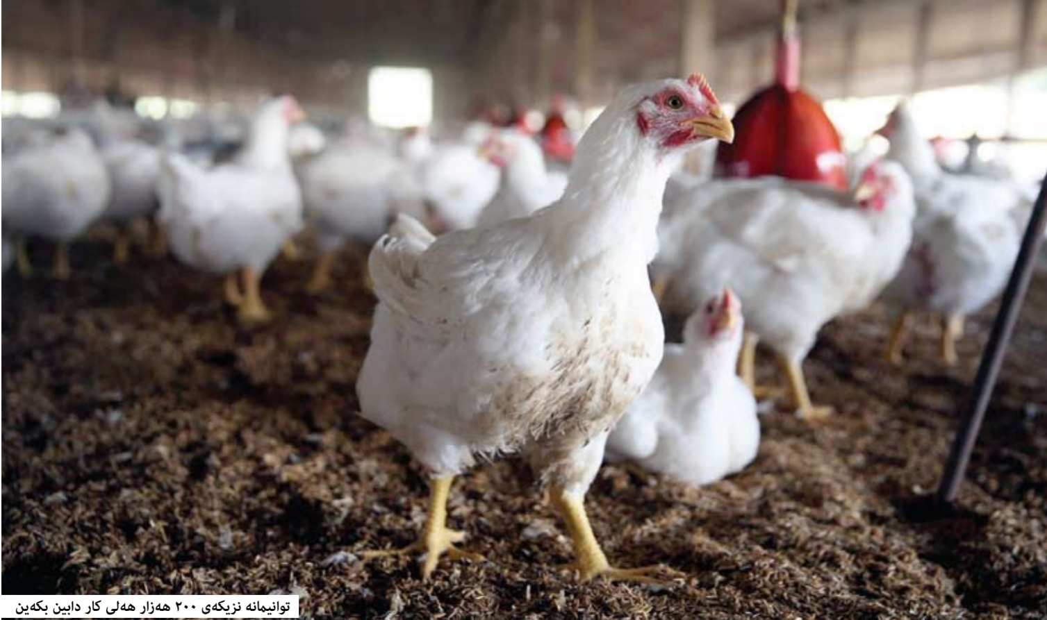
توانیمانه‌ نزیكه‌ى ٢٠٠ هه‌زار هه‌لى كار داپین بکه‌ین

له‌به‌ر پـرۆژەى خـسۆى له‌م چه‌ند داپینكردنى سوتمه‌نى، چه‌ندین بواری رۆژه‌ى داویدا هه‌شال بافل تاله‌بانى، تر، بۆیه‌ توانیمانه‌ نزیكه‌ى ٢٠٠ هه‌زار هه‌لى كار داپین بکه‌ین .