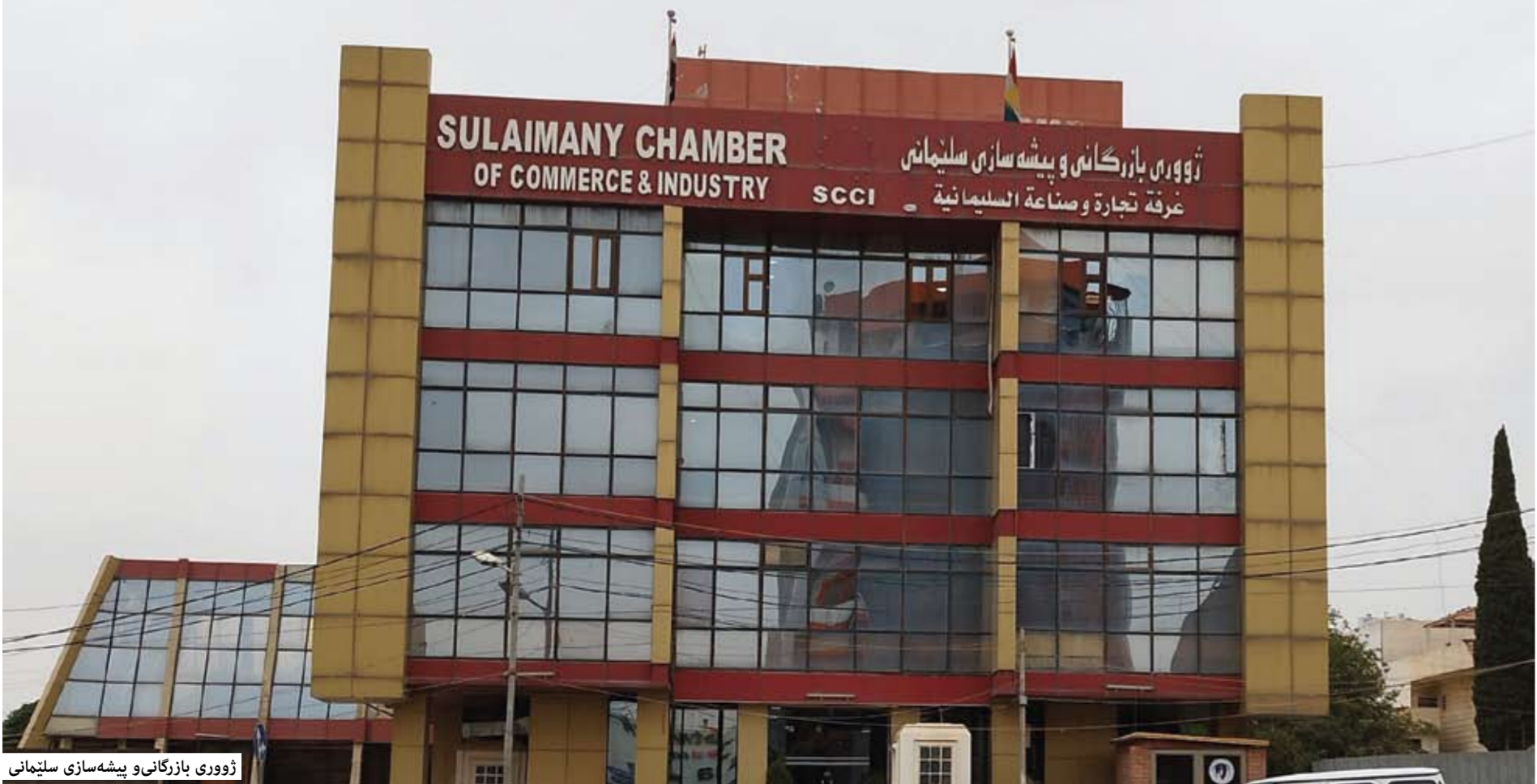
ژووری بازرگانو پیشه‌سازی سلیمانئ

وتیشی "ئێمه‌ له‌ئێستادا ئاماده‌کاری ده‌که‌ین بۆ میوانداری کردنی سه‌رجه‌م سه‌رۆکی ژووره بازرگانیه‌یکانی پارێزگا‌کانی عێراقو هه‌رێمی کوردستان که‌ به‌شدار ده‌بن له‌ کۆبوونه‌وه‌که‌دا، هه‌روه‌ها بانگه‌ێش‌تی سه‌رجه‌م به‌ریرسانی شاری سلیمانئ ده‌که‌ین بۆ ئه‌و کۆبوونه‌وه‌یه‌وه ئاماده‌بوون له‌و پ‌پ‌رۆژه‌ی ب‌چ‌و‌کو مامنا‌وه‌ند ب‌دات که‌ خواست‌یکئ زۆر هه‌یه‌ بۆ ئه‌نجاندانی، به‌لام به‌داخه‌وه تا‌کو ئێستا زه‌مینه‌ی له‌بار نه‌ه‌خ‌سه‌وه بۆ دروستکردنی ئا‌وچه پیشه‌سازییه‌کان، له‌‌روی بازرگانیه‌وه داواکارین ئاسانکاری زیاتر بۆ بازرگانان ب‌ک‌رێت‌و کێش‌ه‌و گ‌رفه‌ته‌کان چاره‌سه‌ر ب‌ک‌رین".