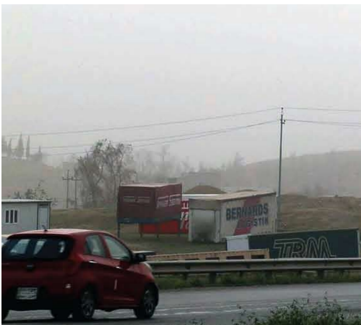
پىشىنى دەكرىت بەدريژايبى ۋەرزى ھاۋىن كارىگەرى خۇلبارين لەسەر عىراقو ھەزىمى كوردىستان بەردەوام بىت

ھەسو ئەم ھۆكارانەش پىكەۋە رىئۇشكىرن بۇ سەررەلدانى گەردەلولى خۇلن.