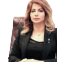
شەن جەزا كەريم

كارگيرى ئەله‌كترۆنى (Electronic Management) ‌ئەو سيستمە نوڅيه‌يه كە بە‌مۆدېرتيرين ستايل كارگيرى ئەبات بپرويه، بۆ دەرياز بون له‌شيوه‌ كلاسيكەيه‌كو كورتكرده‌وى‌ى كاتو ژوو پارگىدنئى ئەركەكانو ئەهيفشنى گەندەلى ئبداړى، هەروها ئاسانگارى دەكات بۆ كارمەندانو هەمو ئەوانەى پەيوەنديان بەچالاكى يان خزمەتگوزارى كۆمپانيا