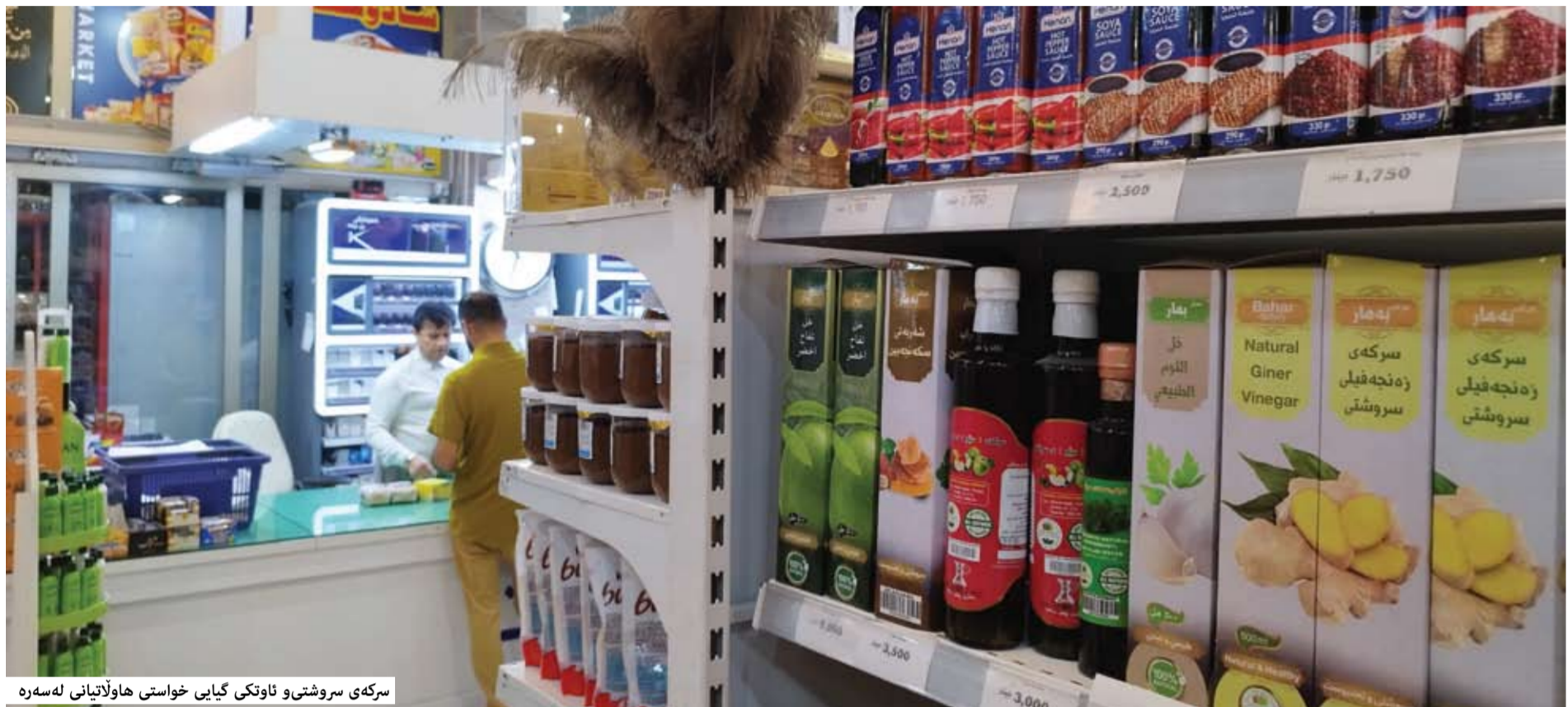
سرگەى سروشتىو ئاوتكى گيايى خواستى ھاولاتيانى لەسەرە

لەرپگەى پۆژەكەيانەو، خاوەنى كارگرى پۆژەى بچوكو مامناوەند سەرچاوەى ھەبوو كە ھەندىكەيان خۇيتەكران بوون، دواى دەستپىكرەنەوئى خۇيتەن رۆشتن ھەلى كار بۆ ھاولاتيانو زياتر پىشت بەستن بە بەرھەمى ناوخۆو رىكرەن لەچوونە موچەكانمان بۆ زىادكرەن گارەكانى ئەو كارمەندانەمان پىداون كە رۆشتون، كارمەندەكان كەمىك ماندوتەر دەين، بەلام موچەكەيان بەرۆژەيەكى بەرچار زىاد كراو . وتيشى "رىكخراوئە ئۆدەولەتسان بەردەوام ھاوكارىمان دەكەن، تاكو ئىستا دوو رىكخراو ھاوكارىيان كردىن، بەكەيكەيان رىكخراوى "GIZ" ى ئەلمانى بوو كە خولپكى وايھەتتاي بۆ كارمەندەكانمان كىردەو دوو ئامىئەرى دروستكرەننى زەيتيان بۆ كرىن، رىكخراوى "USAID" ى ئەمريكيش ھاوكارىيان كردىن بۆ كرىنى چەند ئامىئەرىكى تاقىگە، بەلام وەكو حكومەتى ھەرتپو لایەنە ناوخۇيەكان ھىچ ھاوكارىيەكەيان نەكرەبون."