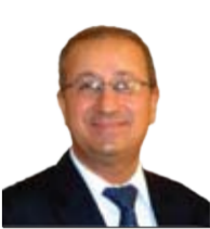
ناراس عمېدولکهريم مەعروف

سلیمانى وەك چـۆن له زوړوېه بواره‌كاندا شاركتى پيشه‌نگو نوڅواړو سره‌مشرق بووه، ئەم‌باره‌ش له‌بواری بازرگانو پيشه‌سازیدا ‌ئو پيشه‌نگيەى خۆى دەسه‌لمېښته‌وه، نەك هەر له‌ناستى كوردستاندا بەلكو له‌سەر ئاستى سەرتاسەرى عىراق ژوورى بازرگانو پيشه‌سازى سلیمانى به‌شازانويه وەك چالاكتين ژوور ديارده‌كړت.